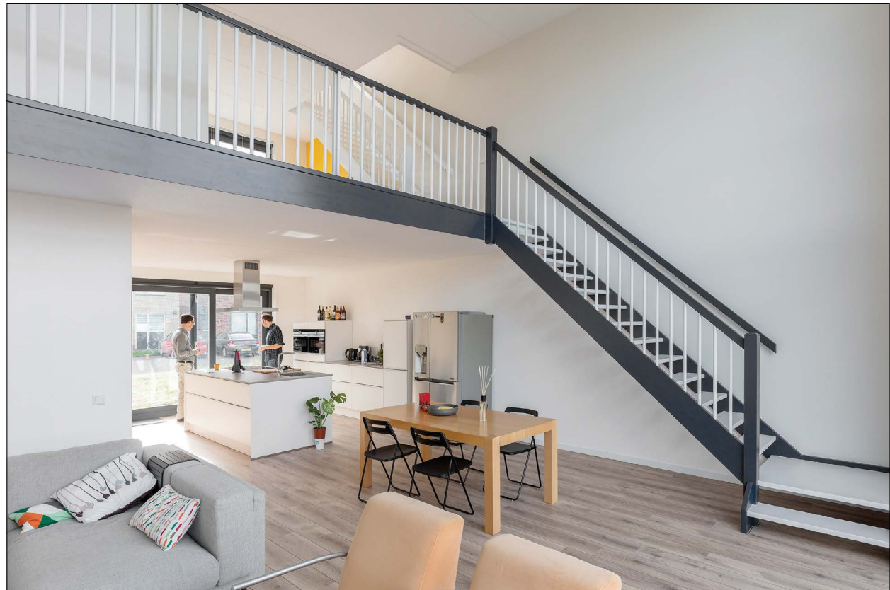
Keuken en open werkruijnte op de verdieping