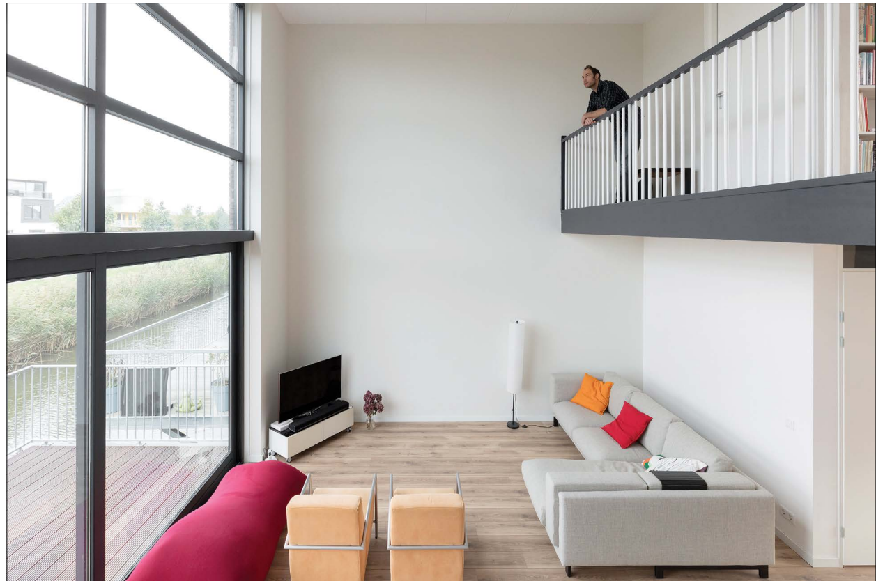
Vide aan de Hectorsingel