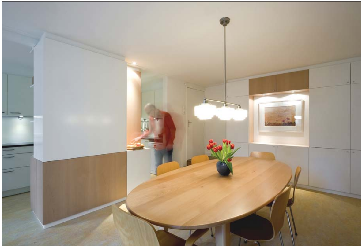
De vernieuwde etkamer